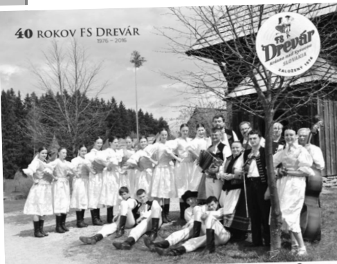
40 ROKOV FS DREVÁR FOLKLÓRNY SÚBOR GROUPE FOLKLORIQUE FOLKLORE GROUP GRUPO FOLCLORICO DREVÁR KRÁSNO NAD KYSUCOU, SLOVENSKO