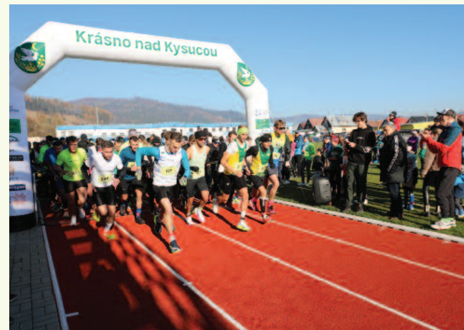
Na štarte 262 pretekárov na novej tartanovej dráhe, ktorú si všetci pochvalovali

Druhá novembrová nedeľa 2024 patrí Krásňanskej desiatke, ktorá tento rok oslavovala 40 rokov od jej založenia . Počasie bolo zrána mrazivé, ale neskôr bežcov zohriali teplé slnečné lúče s teplotou okolo 4 °C. V hlavnej kategórii behu na