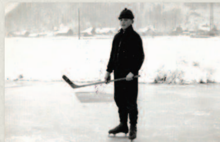
Mladý korčuľiar na zamrznutej Kysuci