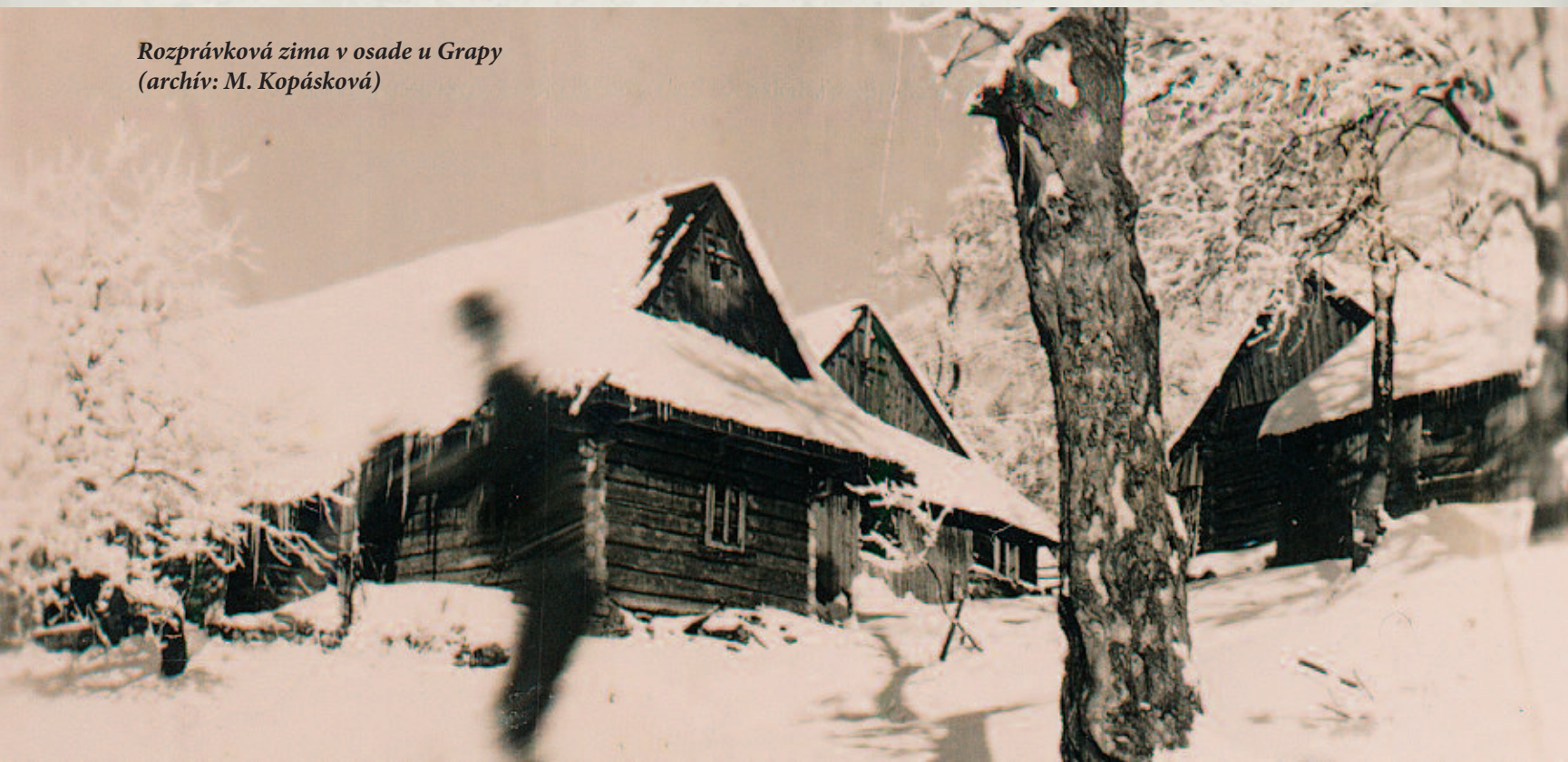
Rozprávková zima v osade u Grapy