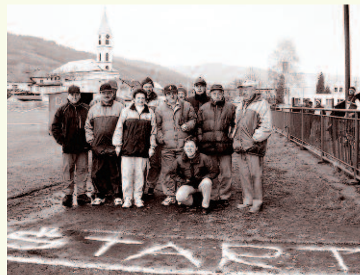
Organizátori Krásňanskej desiatky v roku 2004, fotografia vznikla krátko po štarte