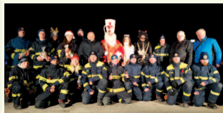
Dobrovoľní hasiči, primátor mesta i dekan si urobili spoločnú záverečnú fotografiu s Mikulášom