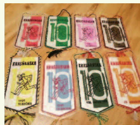
Na prvých ročníkoch pretekári dostávali aj takéto pamätné vlajočky

bežcov: „Krásňanská 10 je záruka elánu, zdravia a radosti zo športu. Želám všetkým, ktorí sa odvážia, aby si do toho išli.“