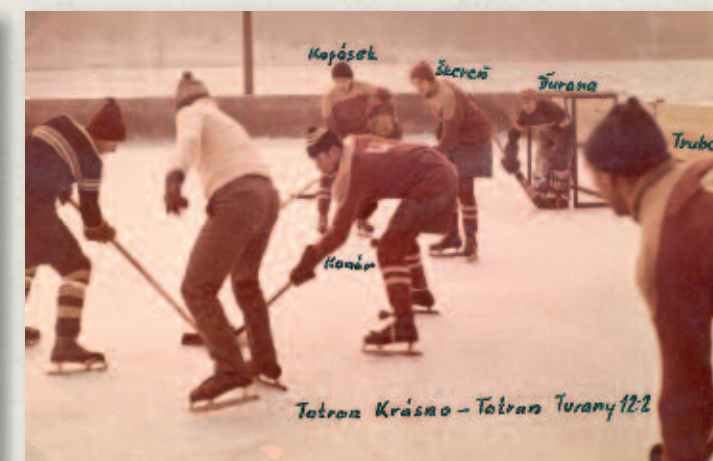
V zápase Tartran Krásno s Tatrantom Turany okolo roku 1960