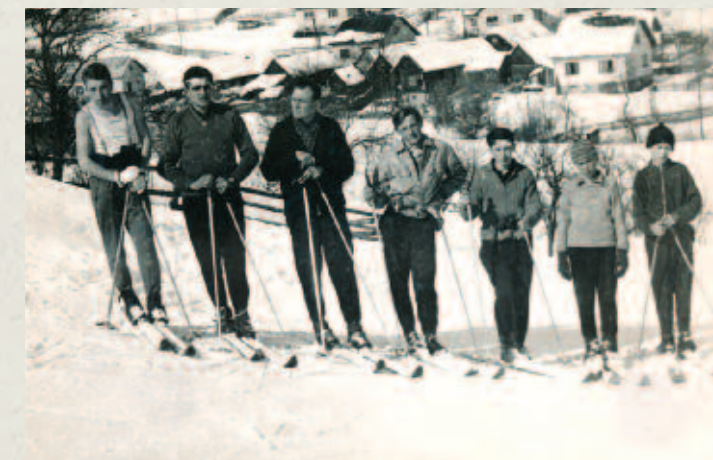
Lyžiar v minulom storočí, bez značkového oblečenia, no mali vždy radosť zo športu okolo roku 1960