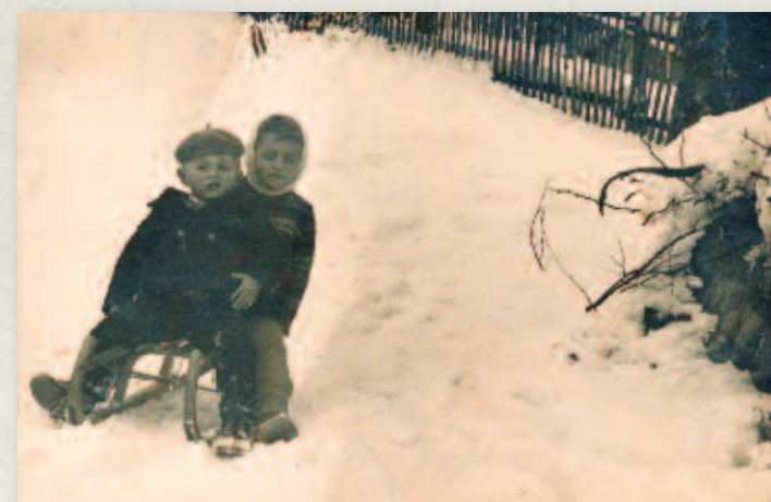
Sánkovačka v osade u Šustkov nad Gavlasovom v roku 1962