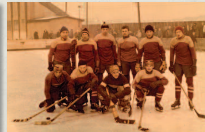
Krásňanské hokejové družstvo v dresoch okolo roku 1960