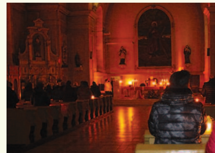
Počas adventného času až do Vianoc sa v našej farnosti, v kostole sv. Ondreja konali rorátne sväté omše len pri svetle sviečok, ktorých sa Krásňania zúčastňovali vo veľkom počte.

Je putovaním po krásňanských kaplnkách, ktoré sa tento rok konali na osemnástich miestach. Kaplnková púť s názvom Tour de Krásno sa stala obľúbenou a jednotlivé miesta navštevujú stovky veriacich i potomkovia pôvodných osadníkov. Nástenný kalendár je možnosť si zakúpiť v sakristii oboch našich kostolov.