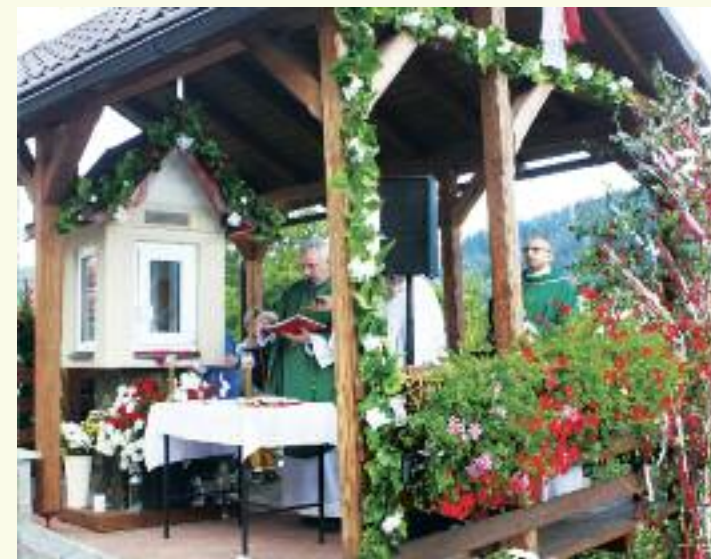
Kaplnková sv. omša U Gundáša, 29. august 2021