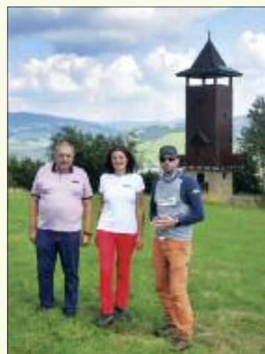
Televíkend RTVS nakrúcaný v Krásne počas turistického pochodu Krížom-krážom osadami

V tomto roku je, na rozdiel od minuloročného zákazu návštev, cintorín otvorený a upravený ako dôstojné miesto posledného odpočinku.