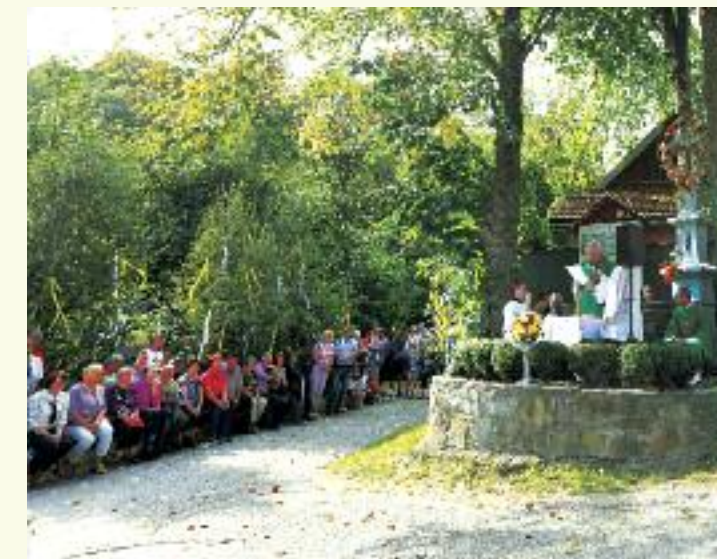
Kaplnková sv. omša pri križi vo Vlčove, 12. september 2021