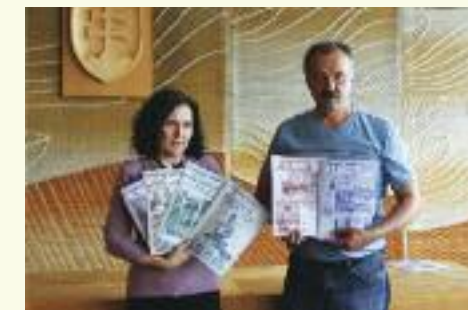
Každý ročník novín bol charakteristický svojou farbou