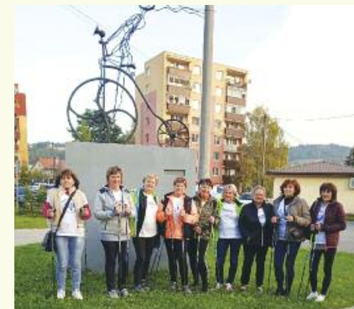
Členovia Ligy proti reumatizmu MP Čadca si v obmedzenom počte walkovaním pripomenuli 12. október – Svetový deň reumatizmu.