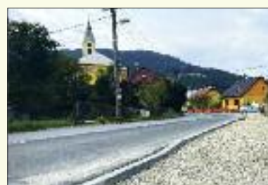
Na Žilinskej ulici pribudol chodník pre chodcov