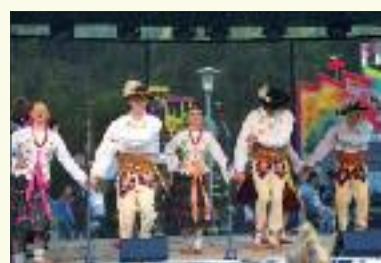
FS Drevár sa ako tradične predstavil na Dňoch mesta 2021