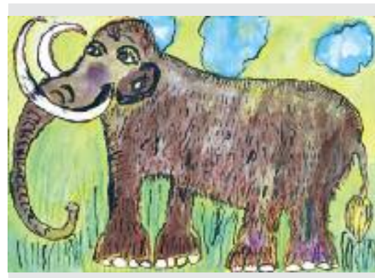
Damiánko Blažek, 5 r., MŠ ocenené dielo