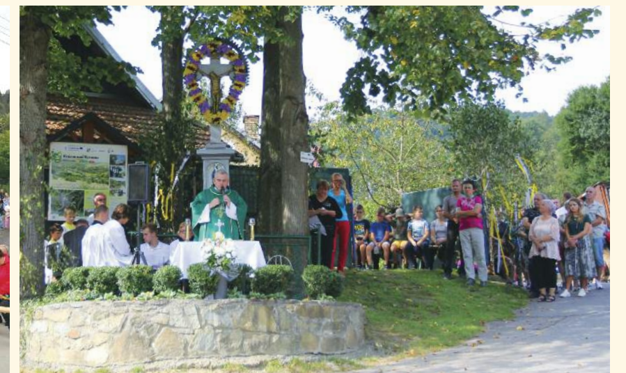
13. septembra pri kríži vo Vlčove