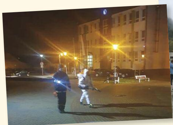
Najväčšie odberné miesto, námestie pred mestským úradom