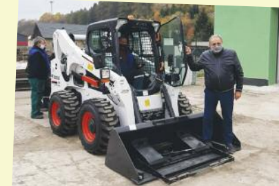
MINISTERSTVO ŽIVOTNÉHO PROSTREDIA SLOVENSKEJ REPUBLIKY OPERAČNÝ PROGRAM KVALITA ŽIVOTNÉHO PROSTREDIA EURÓPSKA ÚNIA Koháňský fond

DO ZBERNÉHO DVORA pribudol nový kolesový nakladač s drvičom drobného stavebného odpadu, pretože súčasťou prídavných zariadení sú paletizačné vidly na nakladanie zlisovaného odpadu, nakladacia lopata na odvoz a manipuláciu so sypkým odpadom. Mesto zaplatilo za kolesový nakladač 5% z obstarávacích nákladov a zvyšok sa uhradil z projektu Európskej únie.