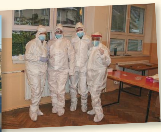
V ZŠ v Kalinove