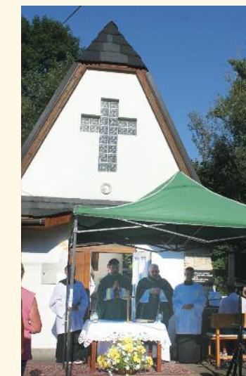
22. augusta, kaplnka na stanici