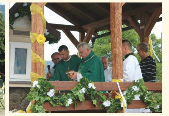
29. augusta U Gundášov