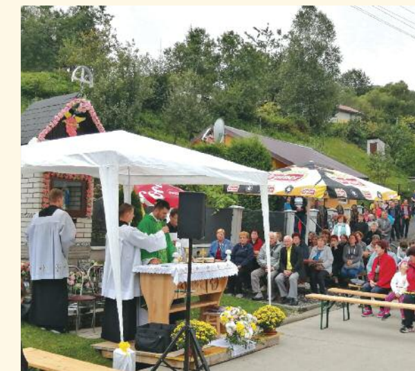
6. septembra U Šustkov, Kalinov

V minulom čísle Krásňana sme priniesli reportáž z prvej časti kaplnkových sv. omši a dnes prinášame tie, ktoré sa konali v auguste a septembri.