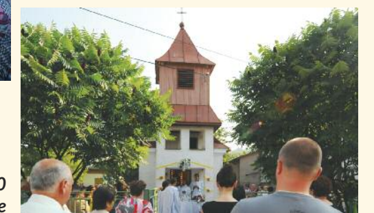
15. septembra 2020 v Kalinove