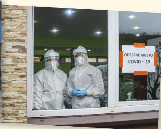
Testovať nám prišli pomôcť zdravotníci z ČR, odberné miesto reštaurácia Da-Sy na stanici