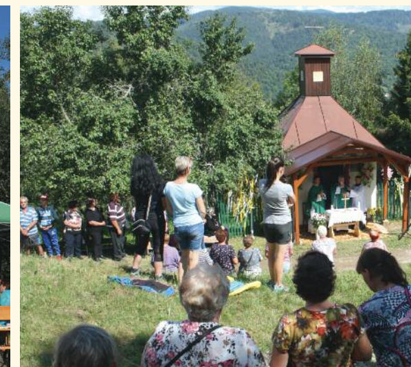
23. augusta, U Gašov