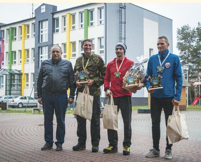
Víťazi Goralmanu 2020 v Krásne