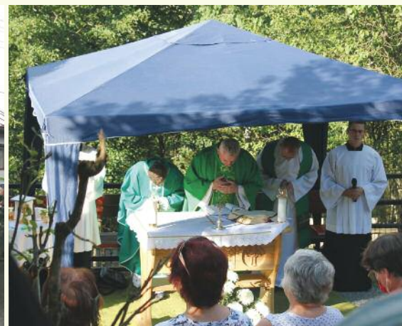
7. 8., Jedličník