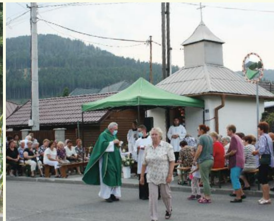
17. 7., pri cintoríne, Foto: L. Hrubý