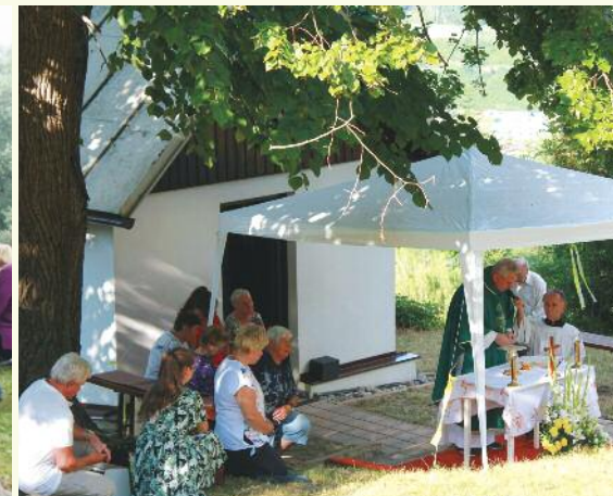
24. 7., U Sýkorov