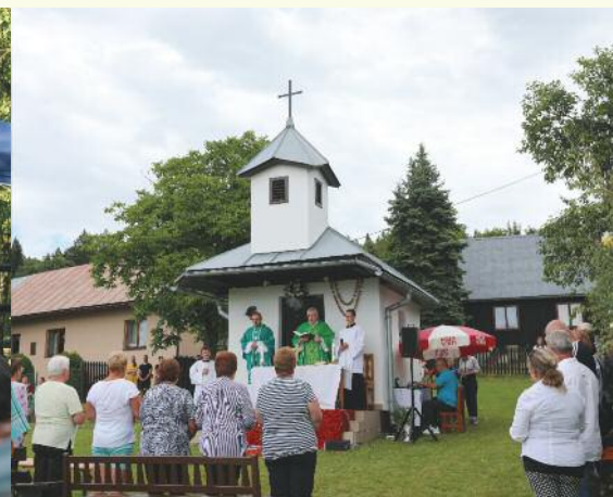
8. 8., U Lastovicov, foto: L. Podoláková