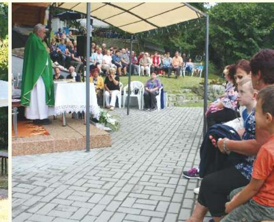
25. 7., U Hacka, foto: L. Hrubý