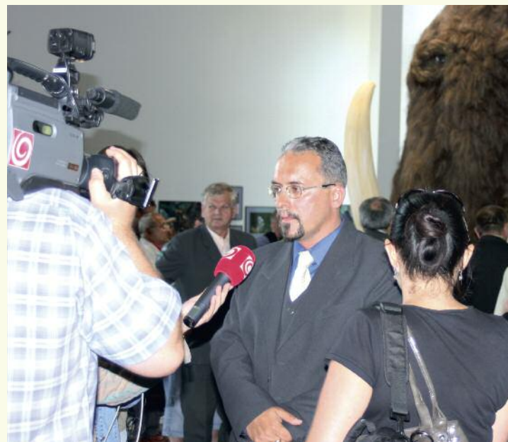
Ako riaditeľ Kysuckého múzea zviditeľnil naše mesto otvorením pobočky múzea, v ktorom je replika mamuta

nem. A pri tejto príležitosti musím veľmi oceniť aj fakt, že Krásňania majú vďaka už tradične prajnému vzťahu otcov mesta ku kultúre stále svoju knižnicu – v dnešnej dobe – ako môžeme vidieť inde – to už nie je samozrejmosťou, a je skvelé, že ako tunajší rodáci máme ku knihám vypestovaný taká nevšedný vzťah. Ak sa mi k tomu v minulosti podarilo prispieť aj v tom smere, že tu máme aj múzeum, cítim to ako veľké osobné zadostučinenie.“