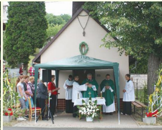
11. 7., U Blažkov, Foto: L. Hrubý