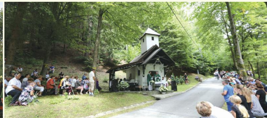
22. 8., Nižné Vane, foto: L. Podoláková