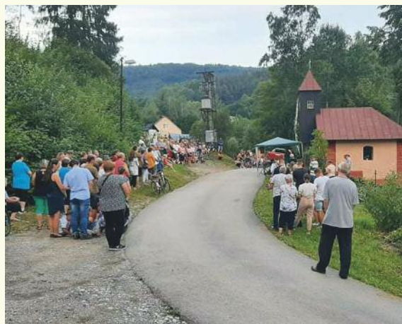
31. 7., U Gavlasa

Krásňanskí veriaci a návštevníci sv. omší ďakujú organizátorom i tým, ktorí sa o kaplnky starajú.