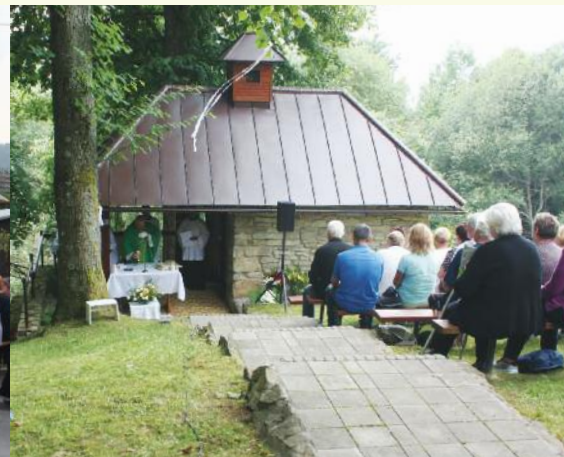
18. 7., U Kuljovských, foto: L. Hrubý