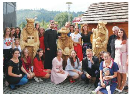
Pán kaplán medzi svojimi farníkmi – posvätenie krásňanského betlehemu a sv. omša pri kaplnke na stanici.

„Milí Krásňania, tieto slová piesne Karola Konárika mi dlho zneli v srdci, keď som sa dozvedel, že sa moje pôsobenie vo farnosti Krásno nad Kysucou v úlohe kaplána končí. Lúčenie s krásňanskou farnosťou bolo pre mňa veľmi ťažkým obdobím. Všetci ste mi totiž prirástli k srdcu.“