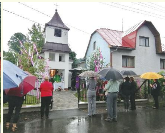
1. 8., pri ZŠ Kalinov