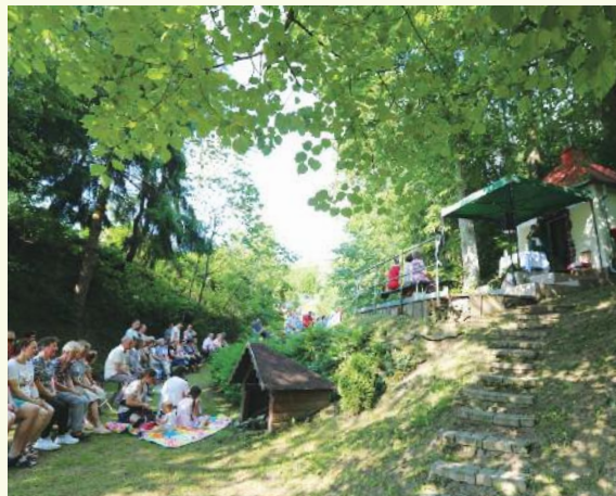
19. 6., Lazný Potok