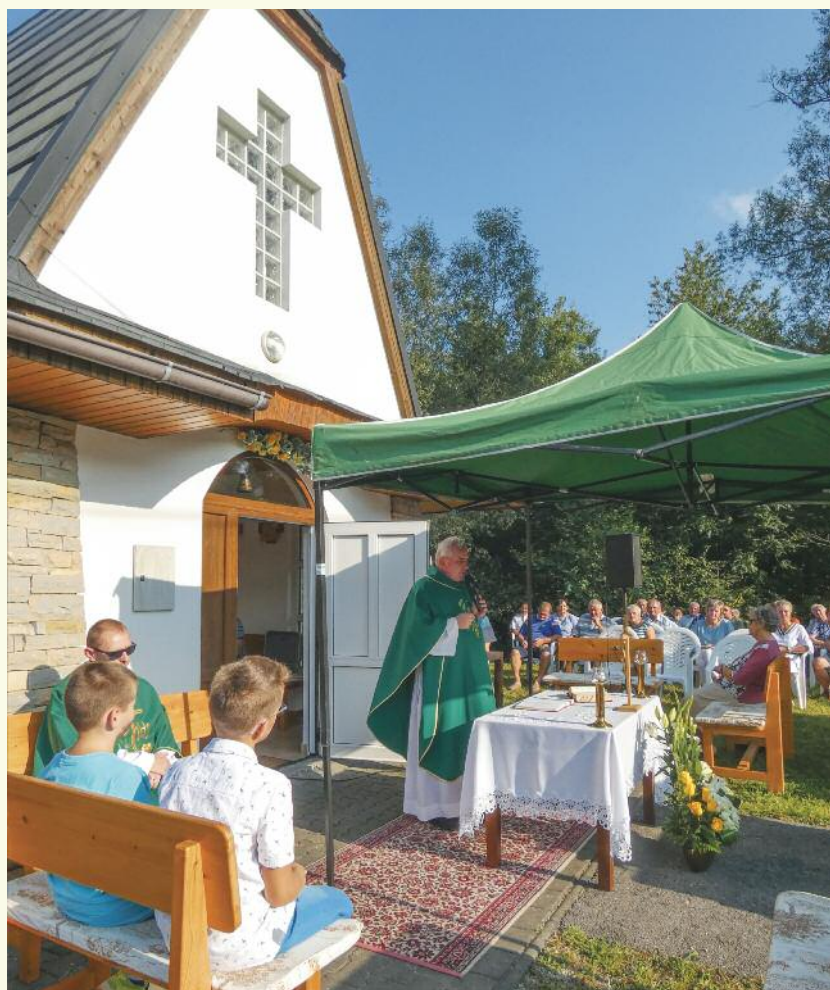
21. 8., na stanici

Aj tento rok sa u nás koná známa kaplnková púť. Počas celého leta. Veriaci ju nazvali Tour de Krásno ako analógiu na svetoznáme cyklistické preteky Tour de France, ktoré sa uskutočňujú približne v tomto období. Celá kaplnková procesia sa skladá z jednotlivých omší. Ľudia sa na nich stretávajú pod holým nebom. Počasie môže vyjsť, môže byť slnečné, horúce, ale býva aj pod mrakom, ba veriacich neraz prekvapí búrka či vytrvalý dážď. Nič ich však neodradí od účasti na podujatí.