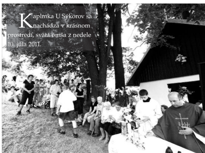
Kaplnka U Sýkorov sa nachádza v krásnom prostredí, svätá omša z nedele 10. júla 2011.