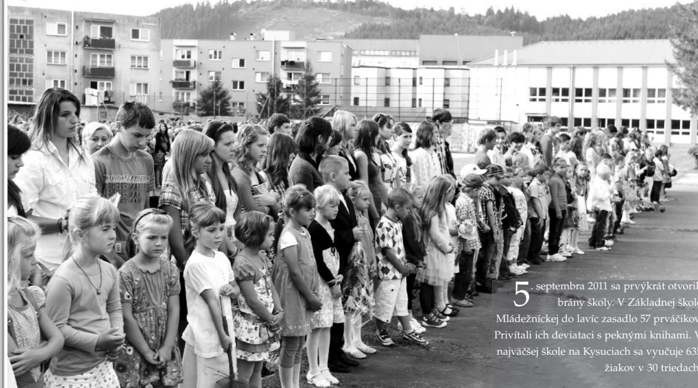
5. septembra 2011 sa prvýkrát otvorili brány školy. V Základnej škole Mládežníckej do lavíc zasadlo 57 prváčikov. Privítali ich deviatci s peknými knihami. V najväčšej škole na Kysuciach sa vyučuje 635 žiakov v 30 triedach.