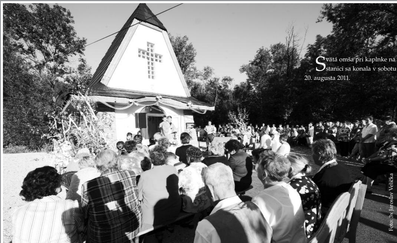
Svätá omša pri kaplnke na stanici sa konala v sobotu 20. augusta 2011.