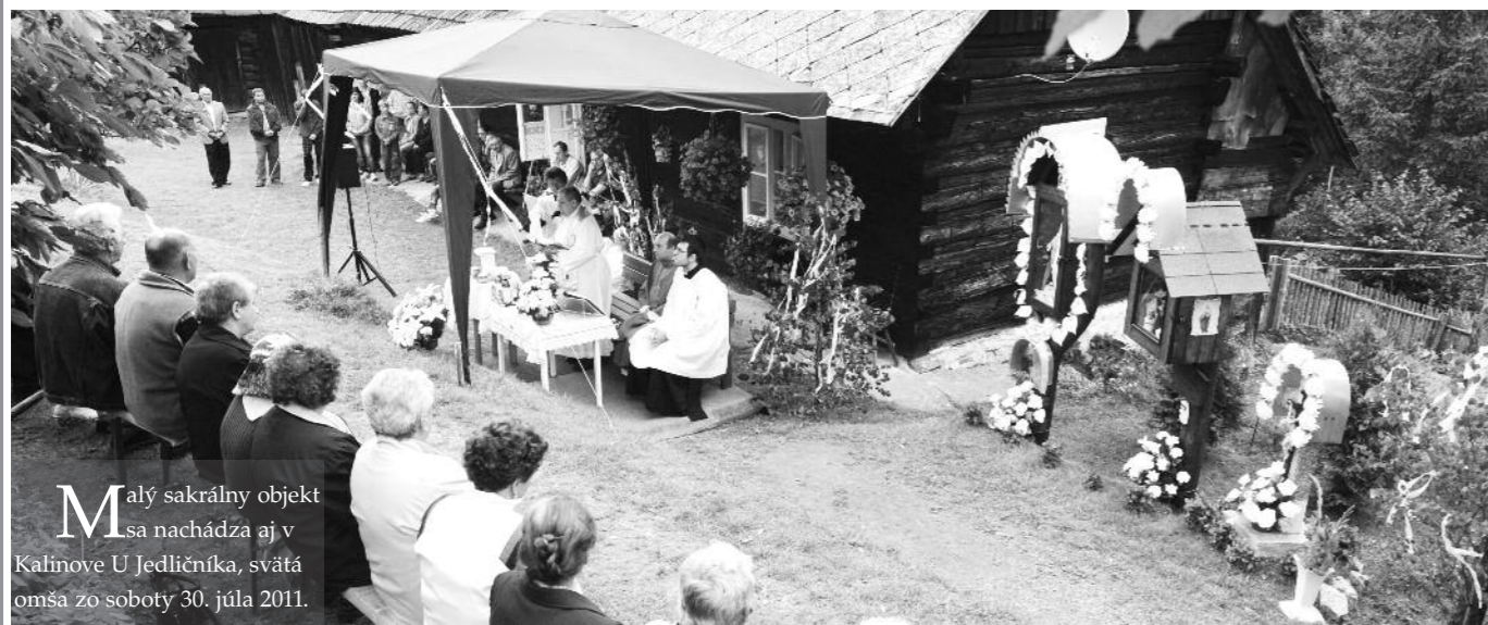
Malý sakrálny objekt sa nachádza aj v Kalinove U Jedličníka, svätá omša zo soboty 30. júla 2011.