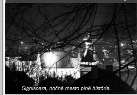
Sighisoara, nočné mesto plné histórie.

Transylvánia, čo v preklade znamená zem ležiacu za lesami alebo lesnatá zem. Náš plán bolo prejsť túto krajinu a nájsť čo najviac zaujímavých miest. Do mesta Bran, kde sa nachádza slávny hrad grófa Drakulu sme prišli až v noci. Všetky hotely a penzióny svietili vyzdobené, skoro ako v Disneylande. Nevedeli sme, kam sa skôr pozerať. Bol to hrozný gýč a bolo vidno, že toto mesto žije hlavne z cestovného ruchu. Ubytovali sme sa v penzióne, kde sme si dali podmienku, že chceme výhľad na hrad. Na ďalší deň sme sa rozhodli vidieť hrad aj zvnútra.