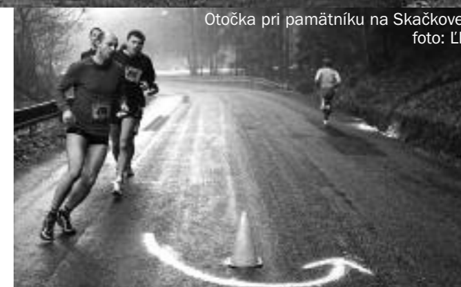
Otočka pri pamätníku na Skačkove