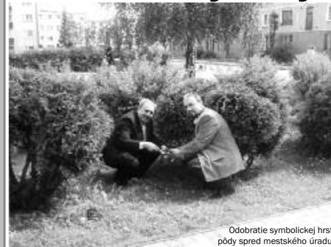
Odobratie symbolické hrste pôdy pred mestského úradu