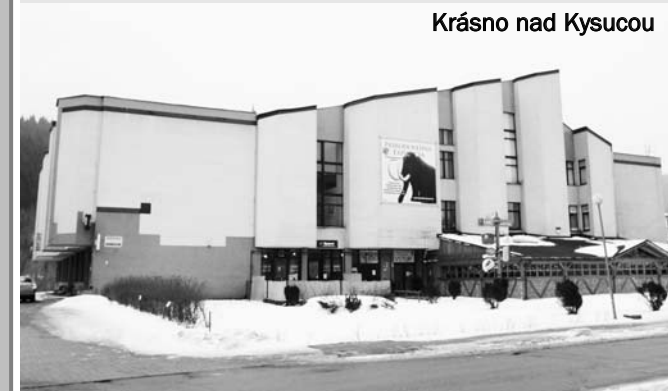
Krásno nad Kysucou

Kto to bol Andy Warhol? A čo je to pop-art? A čo všetko s tým spoločné má Krásno nad Kysucou? Veľa otázok na začiatok. Dlho som o tom ani ja netušila, ale raz... Náhodne, keď som v televízii uvidela budovu múzea. Zdala sa mi nejaká povedomá, začala som pátrať po súvislostiach. Na skoro každú otázku, musí byť aj odpoveď. A tak sa vyriešila jedna záhada... Krásno nad Kysucou verzus Medzilaborce.