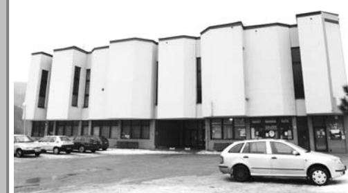
Krásno nad Kysucou

Interiér Warholovho múzea. Farebné schody - naše vedú ku knižnici a výstavné miestnosti.