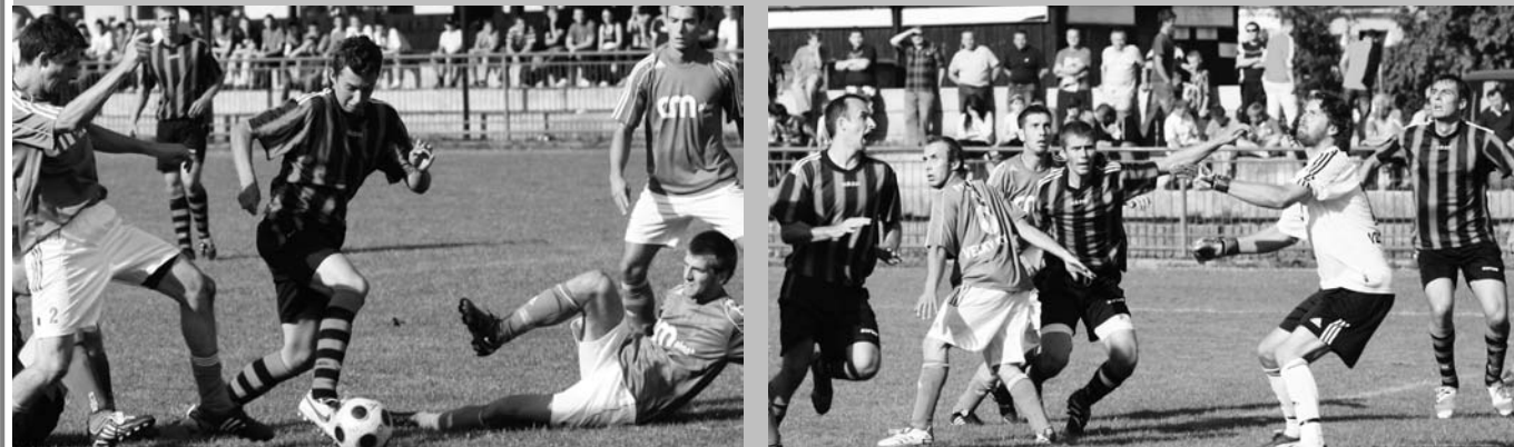
Zo zápasu s Veľkým Krtíšom...