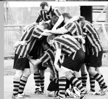
Radost z víťazstva nad Dolnou Ždaňou