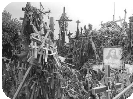
„Hora Krížov“, Litva

Najkurióznejšou a súčasne i najnižšou bola iba asi 25 m vysoká „Hora Krížov“ v Litve. Táto hora je doslova pokrytá niekoľko sto tisíckami krížov vo veľkosti od 1cm do 8m, hora vznikla ako protest Litovčanou proti politickému režimu. Viackrát ju buldozéry zrovnali so zemou, no ľudia vystavili ďalšiu a ďalšiu. V človeku to zanechá hlboký vnútorný dojem. Protipólom tejto hory bola druhá najvyššia „hora“ Dánska so zaujímavou rozhladňou umožňujúcou ďaleký rozhľad úrodnou rovinatou dánskou krajinou.