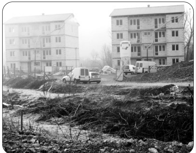
Bytová výstavba v Zákysuči pokračuje, urobená je už vnútorná inštalácia a vodoinštalácia a vnútorné omietky