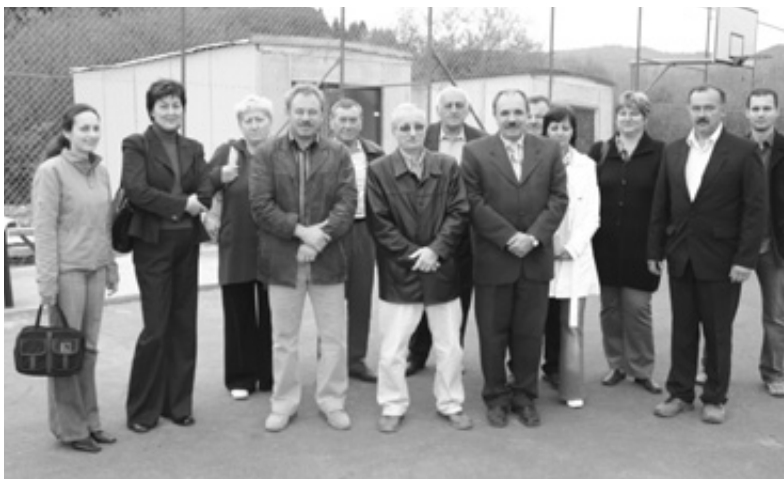
Foto: Z kolaudácie ihriska v Kalinove