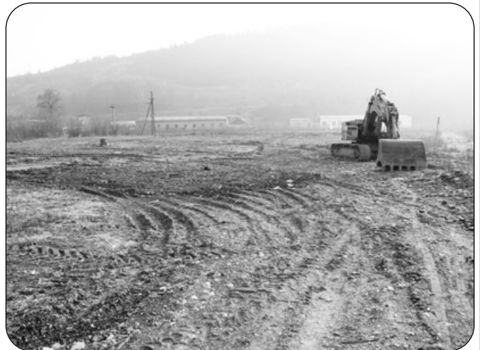
Pripravovaná plocha pre výstavbu štyroch bytových domov, kde bude 48 bytov