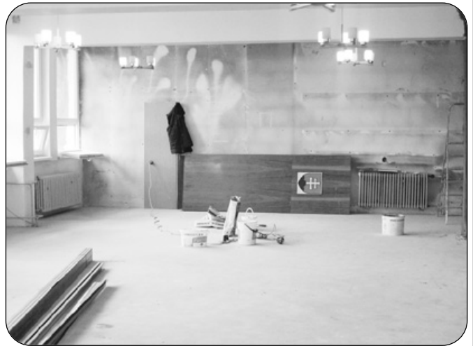
Rekonštrukcia veľkej zasadačky na mestskom úrade