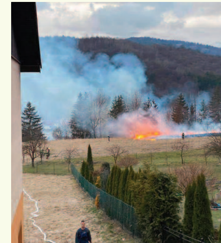
27. marec 2021 – výjazd po 17. hodine k požiaru trávnatého porastu U Blažkov.