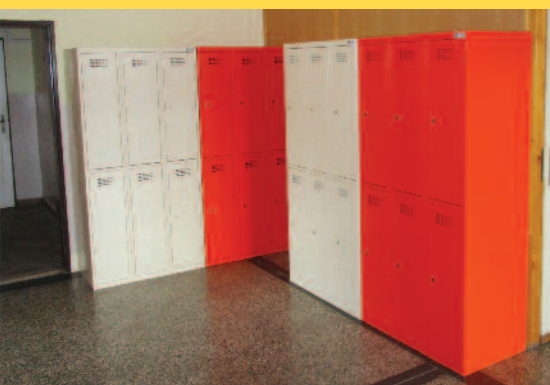
Šatníkové skrinky pre žiakov.

Základná škola Mládežnícka čas neprítomnosti žiakov využila efektívne a pustila sa do obnovy spoločných priestorov a skultúrneho tried, zmodernizovania kotolní, výmeny výhrevných telies v triedach, zakúpili sa nové žiacke šatníkové skrine.