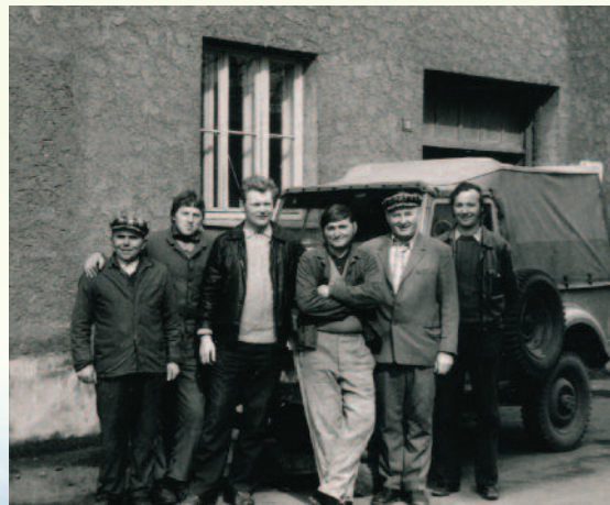
Ako elektrikár pracoval celý život. Na fotografii s kolegami, elektrikármi.