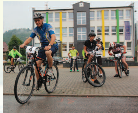
Rád sa zúčastňuje na preteku Cyklo 20tka, ktorá vedie Bystrickou cyklomagistrálou.