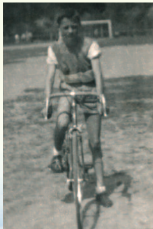
Cyklistike sa venoval od školských čias.

Ako chlapci sme sa hrávali na trávnatých ihriskách a som rád, že dnešná mládež má k dispozícii krásne a moderné športoviská, kiez by si to viac vážili a neničili ich. Aj pri spoločnej stavbe ihriska v Kalinove sme na to mysleli. Svoje vnúčatá vediem k športu, pretože v tom vidím zmysel. Ako človek, ktorý si pamätá staršie časy, zvyknem pripomínať, aby sme si chránili a vážili to, čo tu máme, týka sa to prírody a aj nášho mesta. Krásno nad Kysucou sa od mojej mladosti veľmi zmenilo, je krásne a moderné a dobre sa tu žije.“