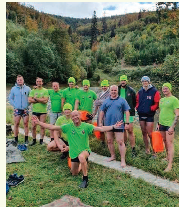
Otvorenia sezóny 2020 – 2021 v zasnežovacej nádrži vo Veľkej Rači – Dedovke sa zúčastnilo 13 členov.