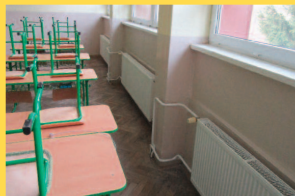
Nové panelové radiátory.

Je nesporné, že kultúra prostredia je jedným z pozitívnych činiteľov významne pôsobiacich na dosahovanie požadovaných výsledkov žiakov. Čím príjemnejšie sa bude človek cítiť v istom prostredí, v tomto prípade v triede, tým úspešnejší môže byť pri zažívaní úspechu. Preto sme triedam žiakov 8. a 9. ročníka dali nový šat. Vymenili sme v nich svietidlá , čím sa dosiahne nielen úspora, ale hlavne nebude rušiť žiakov nežiaducou rezonanciou pri ich sústredení sa na prácu. Výmena sa zrealizovala v pavilónoch A aj B. Vypravili sme malovku, vymenili staré rebrové radiátory za nové panelové, vstupné dvere do tried i kabinetov v pavilóne A , čím sme zvýšili bezpečnosť i ochranu zdravia žiakov ako i zlepšenie psycho-hygienických podmienok žiakov, aby sa po svojom návrate do školy cítili príjemne a mohli čo najintenzívnejšie zažívať úspech počas vyučovania.