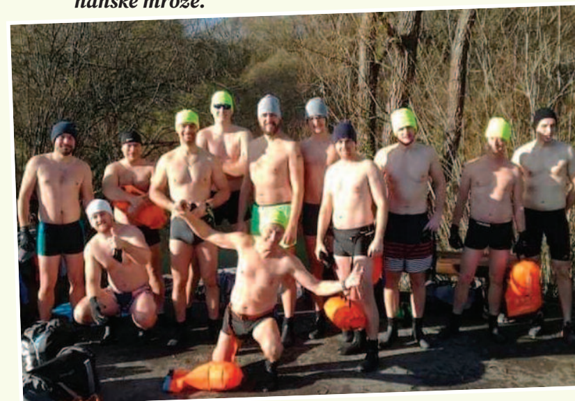
Najradšej sa otužilci kúpu v rieke Kysuci pri teplote 4 – 0 stupňov.