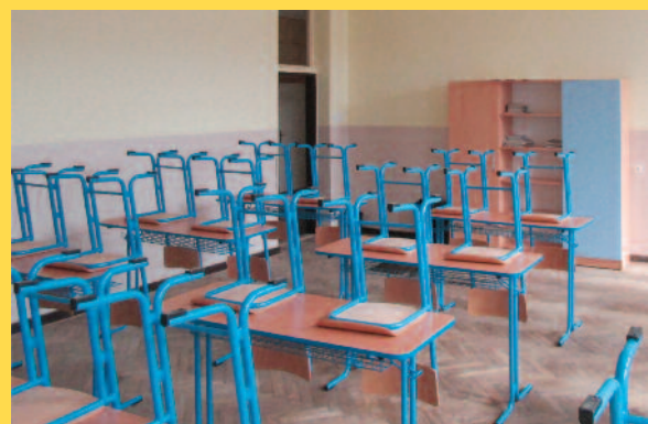
Nový školský nábytok.