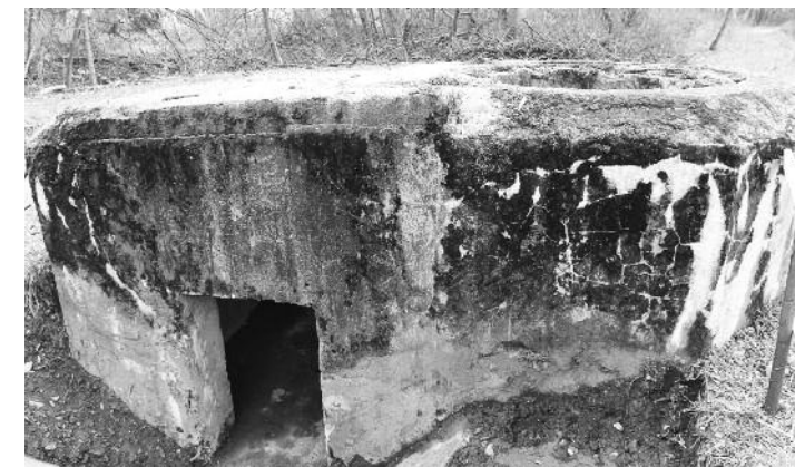
Betónové bunkre sa nachádzajú na viacerých miestach v Krásne, v Kalinove a na cyklotrase.

povali cez Oravu vojaci 18. armády 4. ukrajinského frontu. V rámci tohto frontu cez Oravu postupovali smerom na Bystrickú dolinu jednotky 159. pešej brigády a 17. gardového streleckého zboru.