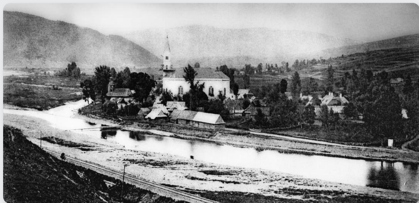
Najstaršia zachovaná fotografia Krásna nad Kysucou z roku 1872. V Krásne bola vystavaná koľaj Košicko-Bohumínskej trate, na fotografii je zachytený aj starý drevený kostolík a vystavaný nový kostol sv. Ondreja.