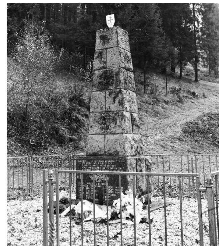
Pamätník na Skačkove