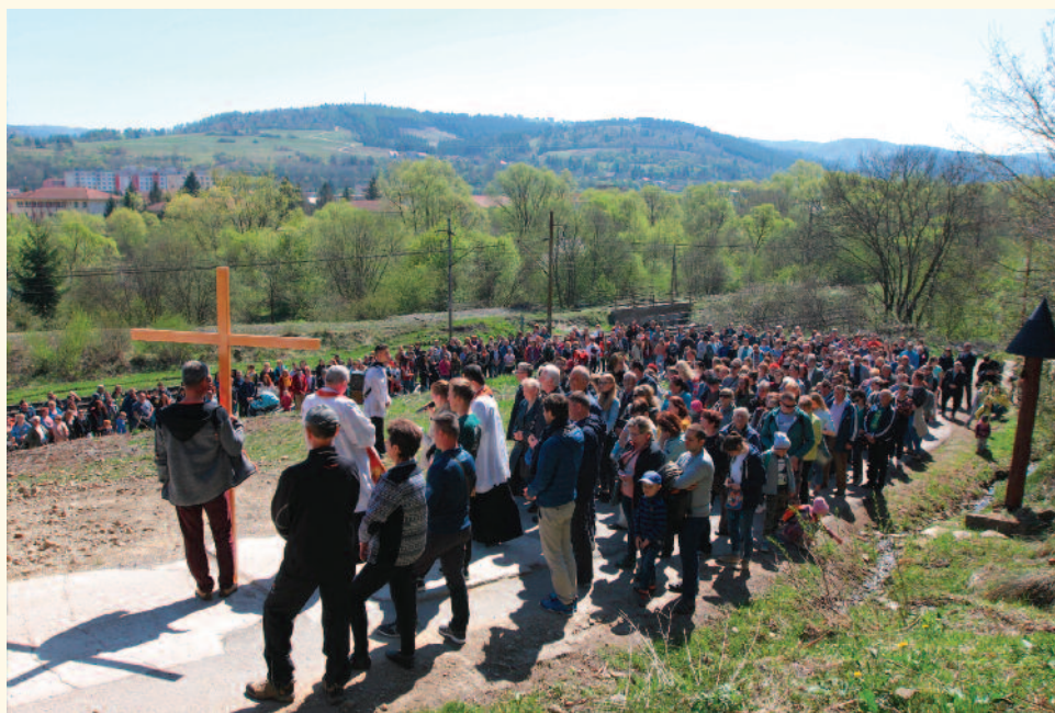
Veľký piatok 2019, konala sa Krížová cesta ku kaplnke do osady Gavlasov.

Gesto Boha, ktoré je vyjadrené krížom, na ktorom zomiera Ježiš, obohatilo každého z nás. Iste aj preto, že na jeho kríži sa nič nezabúda. Je tam bolesť nevyliciteľne