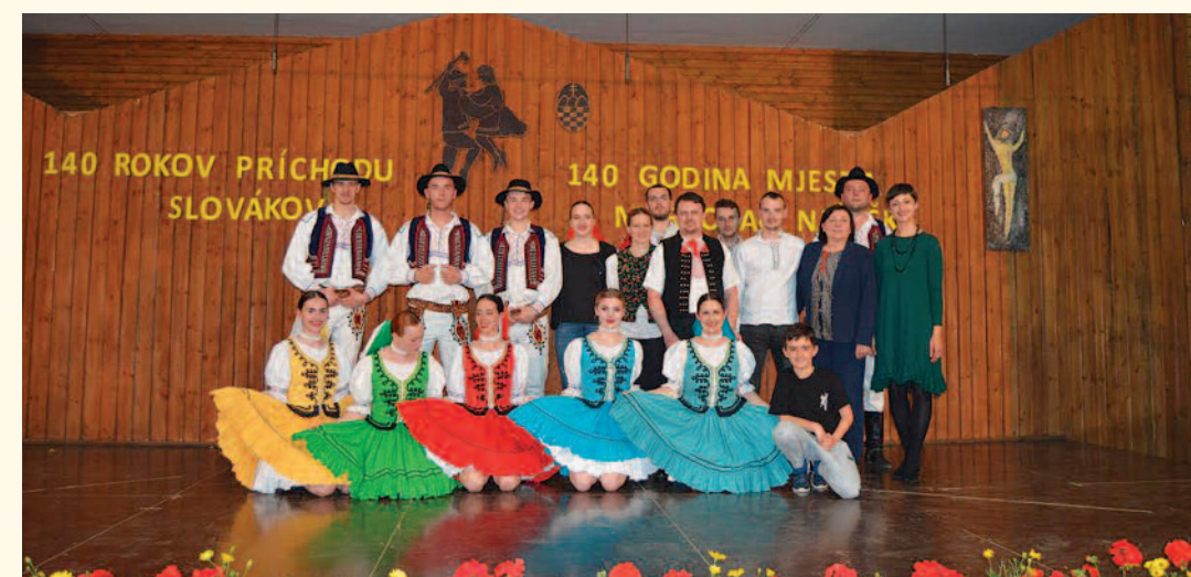
Folklórny súbor Drevár vystupoval v minulom roku v Chorvátsku.