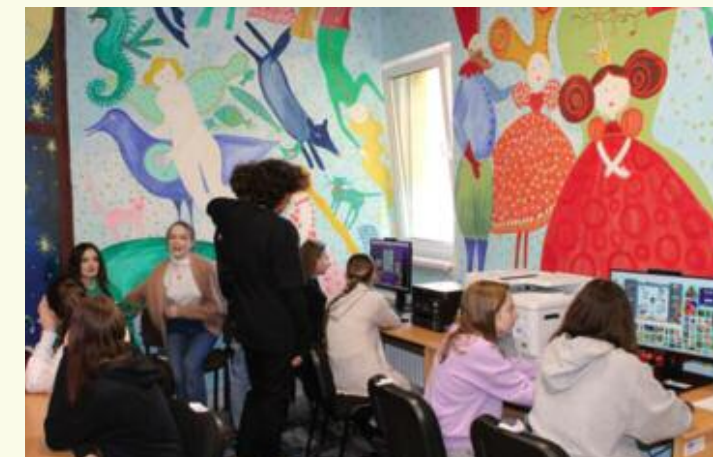
Žiaci základnej školy vyskúšali nové počítače a tlačiarne

Mestská knižnica je vzdelávacou inštitúciou, preto si zaslúži nielen čitateľskú pozornosť, ale i moderné technické vybavenie.