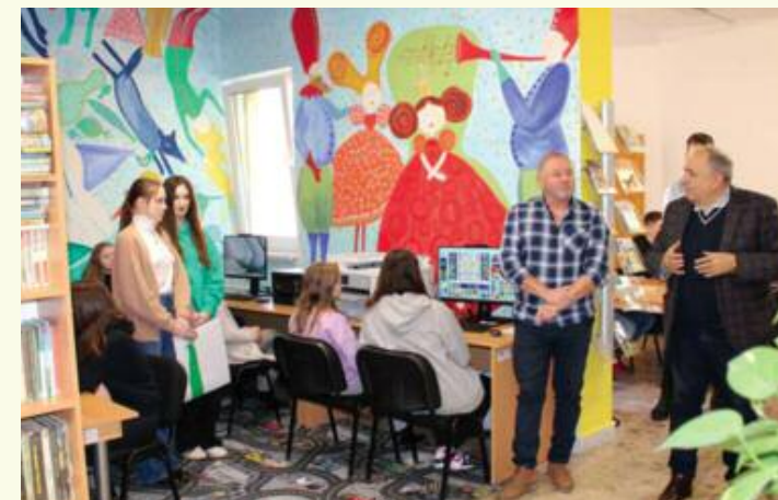
Primátor a zástupca mesta so žiakmi ZŠ vo vynovenej knižnici