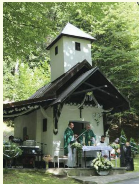
Kaplnku u Nižných Vaní postavil jej dedo Ondrej Koňuch