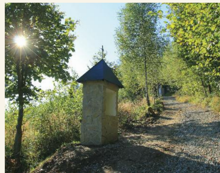
„Dedičstvo Otcov, zachovaj nám, Pane.“