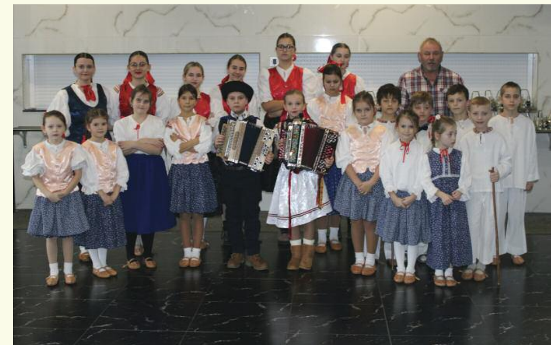
Krásny kultúrny program pre jubilantov pripravili naši folklóristi

príbytkoch. Nemajú veľa možností ísť do spoločnosti, stretnúť sa s priateľmi, pohovárať sa, zabudnúť na starosti, trápenia a choroby. Teší nás, že seniori prichádzajú na toto stretnutie, o čom svedčí, že naša práca nie je zbytočná ale splňa svoj účel.