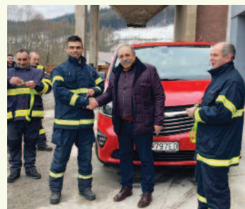
Dobrovoľným hasičom sa podarilo vyzbierať peniaze na 9-miestne auto