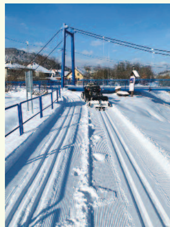
Začiatok roka 2023 prial bežkárom a milovníkom zimných športov a konať sa mohla aj Krásňanská stopa