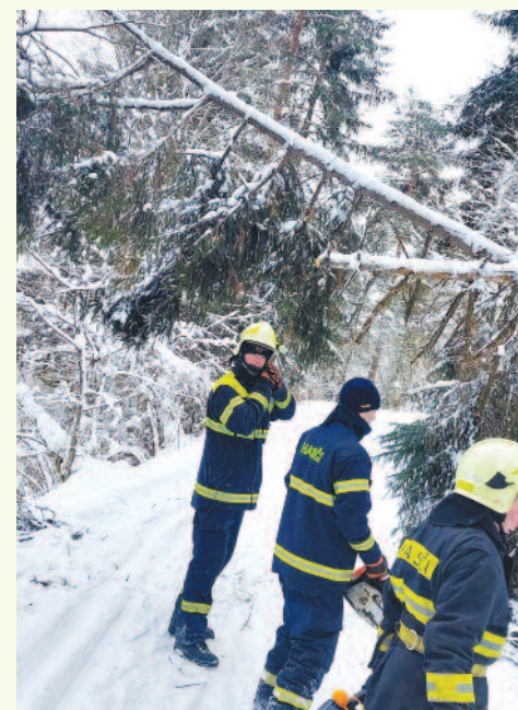
Ťažký sneh a popadané stromy vytiahli do akcie našich hasičov, 5. februára 2023.

Od februára 2023 bola upravená pre nadšencov bežeckého lyžovania cyklotrasa od Krásna nad Kysucou až po Novú Bystricu. Strojovo upravená bežkárská stopa bola aj na úseku cyklotrasy do Dunajova a Oščadnice.