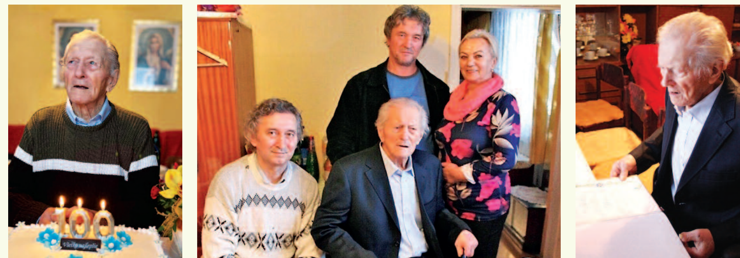
Krásne životné jubileum oslávil so svojimi najbližšími a zablahoželat mu prišlo i vedenie mesta a tiež regionálne médiá