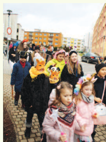
Fašiangový maskový sprievod prechádzal našim mestom, spievalo sa i tancovalo a nechýbali chutné šišky