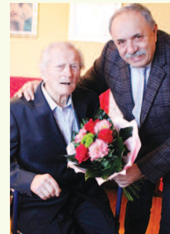
S primátorom mesta