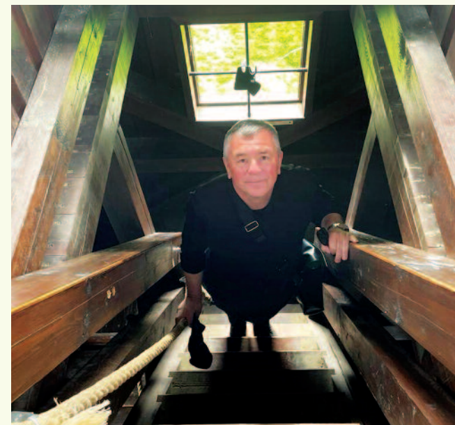
V rodnom Krásne na rozhladni na vrchu Diel