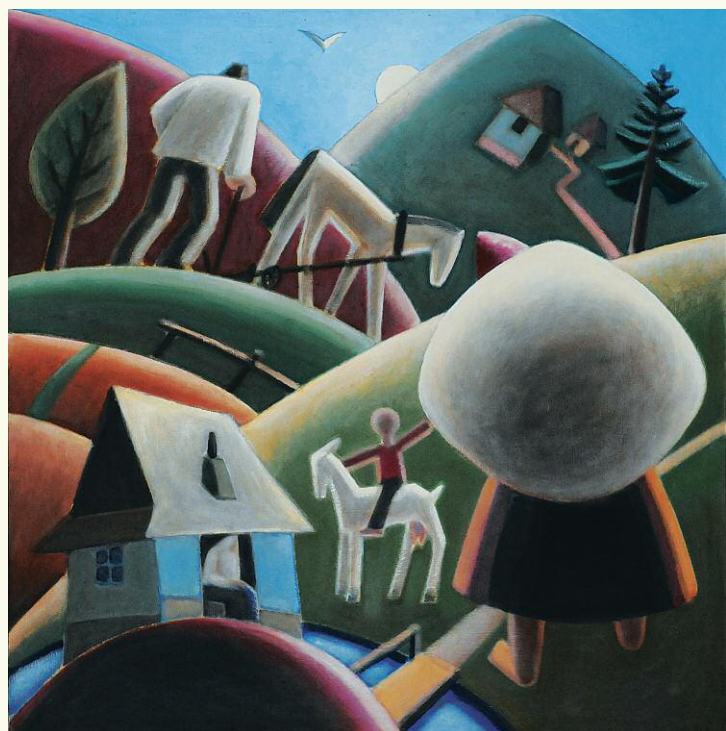
Kopanice, 80x81 cm