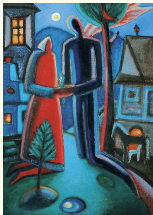
Večerná modlitba, 46x66 cm