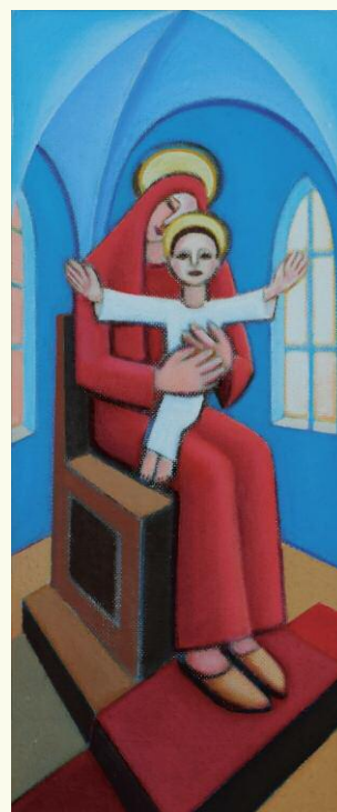
Madona z modrého kostolíka, 25x60 cm