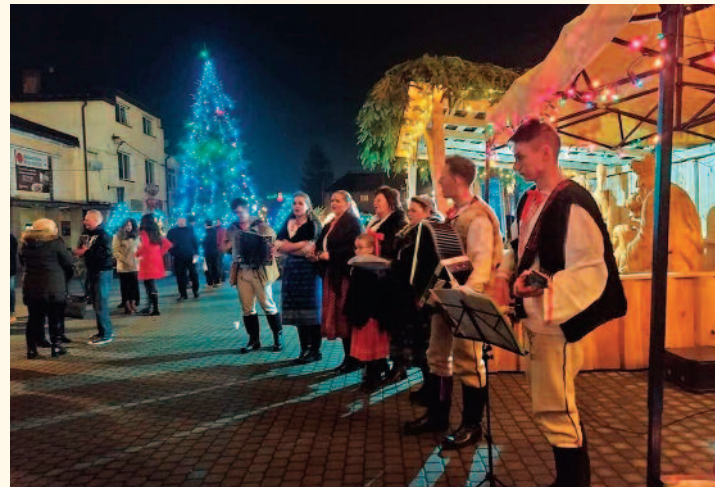
Skupina Kysucká muzička pred kostolom a pred dreveným Betlehemom po slávnostnej polnočnej sv. omši.

bytkov ľudí a zvestovali narodenie Spasiteľa. Zároveň zbierali finančné dary na pomoc ľuďom, ktorí sú v núdzi a nemá sa kto o nich postarať. Samotná Dobrá novina je u veriacich obľúbená. V našej farnosti chodili koledníci niekoľko dní, aby stihli ponavštevovať všetky domy, ktoré boli zapísané na zozname v kostole. Neboli to však len rodinné obydlia, ale aj byty na našich sídliskách. Chodili najmä deti v skupinkách. Zahrali a zaspievali koledy, zavínšovali zdravie, šťastie, pokoj. Ľudia ich všade vítali a za vinše im ponúkli rôzne dobroty. Koledníkom tento