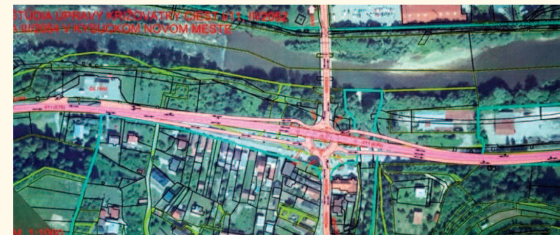
Navrhovaná mimoúrovňová križovatka na hlavnom smere Čadca Žilina, ktorá by mohla byť vybudovaná do 2 rokov. Prioritou je samozrejme riadna dostavba diaľnice D3 na Kysuciach.

Otázkou je, prečo ministerstvo nepredložilo samotný návrh a s riešením musia prichádzať iní. O tom, že budovanie diaľnice D3 je v sklze, vedia kompetentní už dlho. Niektoré úseky neprešli ani fázou obstarávania projektovej dokumentácie. Na túto otázku ťažko dostaneme uspokojivé vysvetlenie, takže neostáva dúfať, že aspoň podobné, hoci dočasné riešenie pomôže vyriešiť kritickú situáciu v našom regióne. Členovia iniciatívy D3 pre Európu však prizvukujú, že zároveň treba prioritne riešiť situáciu systémovo – dobudovaním D3 na Kysuciach v čo najkratšom termíne.