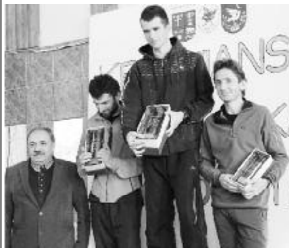
Organizačný tím Krásňanskej desiatky