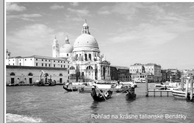
Pohľad na krásne talianske Benátky

„Jeden z dôvodov štúdia bol ten, že diecéza potrebuje i kňazov s týmto vzdelaním. Tí potom pôsobia napríklad i v diecéznom súdnom tribunále, popri ostatných svojich pastoračných povinnostiach. Na Slovensku zatiaľ nebolo možné študovať kánoniké (cirkevné) právo a preto to štúdium bolo možné iba v