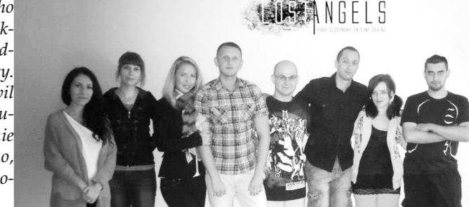
Členovia LA tímu