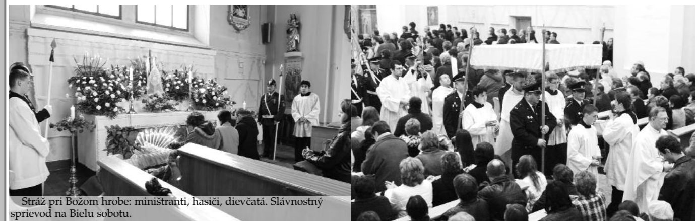
Stráž pri Božom hrobu: miništranti, hasiči, dievčatá. Slávnostný sprievod na Bielu sobotu.