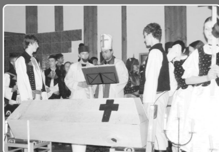
Z kultúry: Pochovávanie basy a Fašiangy