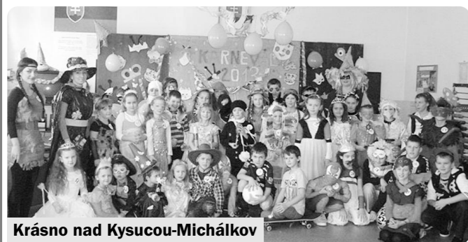
Krásno nad Kysucou-Michálkov