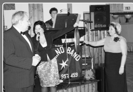
Tradičný ples: 5. reprezentačný ples