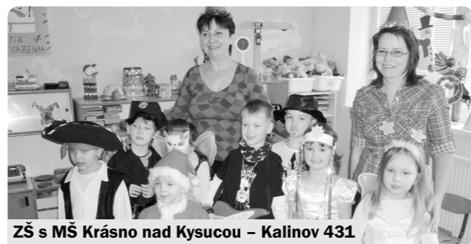
ZŠ s MŠ Krásno nad Kysucou – Kalinov 431

Hoci väčšinu detí skolila nepríjemná chrípka, tí, čo prišli, neoľutovali. Tancovali, súťažili, zabávali sa a hostili princezná, motýličky, mušketier, policajta, rocker, piráta, ba i Mikuláša. Čítali sa ako v rozprávke. A viete, čo ich potešilo najviac? Že sa s nimi prišli zabaviť aj ich rodičia. Každá maska bola jedinečná a krásna. Odmenou pre deti boli nielen chutné a voňavé šišky, teplý čajík, džús a iné dobroty od mamičiek, ale aj nové pastelky, pestrofarebné balóniky a vlastnoručne vyrobené karnevalové klobúčky, ktoré si pyšne odnášali domov, aby sa mohli opäť tešiť celý rok na nové zážitky a na ďalší karneval.