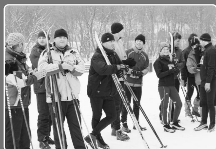
Zo športu: Krásňanská stopa 2013