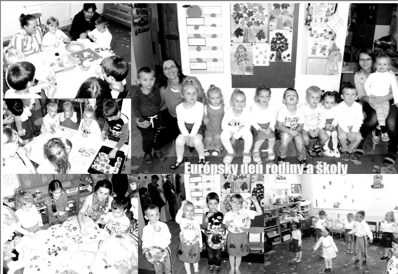
Európsky deň rodiny a školy