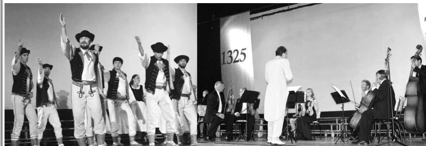
Folklórny súbor Kysučan, Kysucký komorný orchester Divadelný súbor Babylon a Divadlo Skala