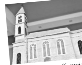
A najväčší kostol na Kysuciach