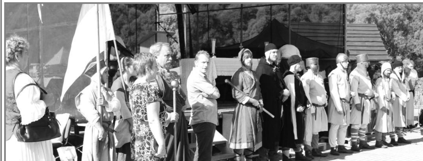
Slávnostný sprievod zastal pod pódium, aby primátor mesta predniesol pozdrav Mládežnícky spevácky zbor Makabi. Na sv. omšu prišli kňazi, krásňanskí rodáci