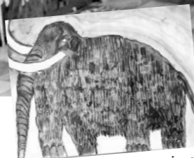
Mamut ako najväčšie zviera