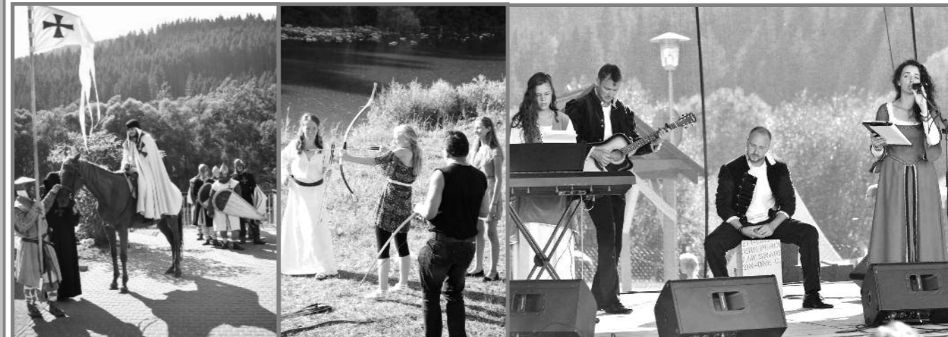
Templárski rytieri, škola lukostreľby, rozprávkoví Badžgoňovci Ocenení futbalisti s primátorom a Kysucký prameň