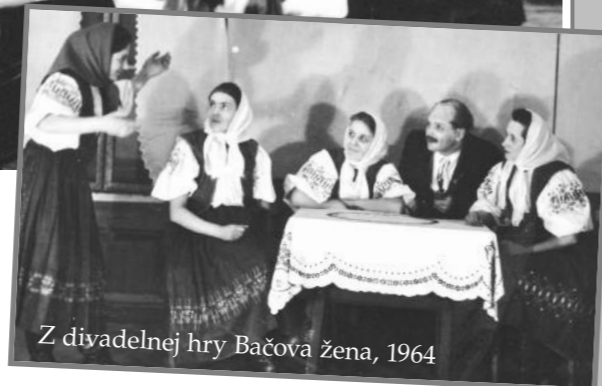
Z divadelnej hry Bačova žena, 1964