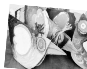
A vrabce, keďže sme vrabčári