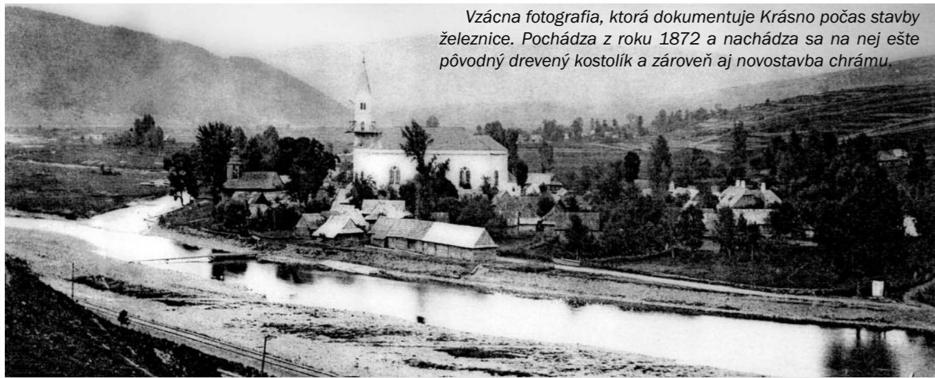
Vzácná fotografia, ktorá dokumentuje Krásno počas stavby železnice. Pochádza z roku 1872 a nachádza sa na nej ešte pôvodný drevený kostolík a zároveň aj novostavba chrámu.

Oslava narodenín má pre nás vždy atmosféru významnosti. Pripomíname si náš zrod a začiatok života. Prvá písomná zmienka je významným bodom v našich dejinách, pretože práve od roku 1325 oficiálne Krásno sa akoby narodilo. Začína sa spomínať v listinách a nie sú to už len lúky a hory, ale v Krásne žijú prví obyvatelia, ktorí tu našli domov. Listiny sú jediné stopy, podľa ktorých si vieme predstaviť, ako to tu v minulosti vyzeralo, čím sa ľudia tu žijúci zaoberali. Stopy nachádzame aj v mapách a starých nákresoch. Až s vynálezom fotografie môžeme vzhliadnuť starú dedinu a život v nej. Najstaršia fotografia Krásna pochádza niekedy z roku 1914. Vybrala som Vám pár zaujímavých fotografií ako to u nás vyzeralo... LP